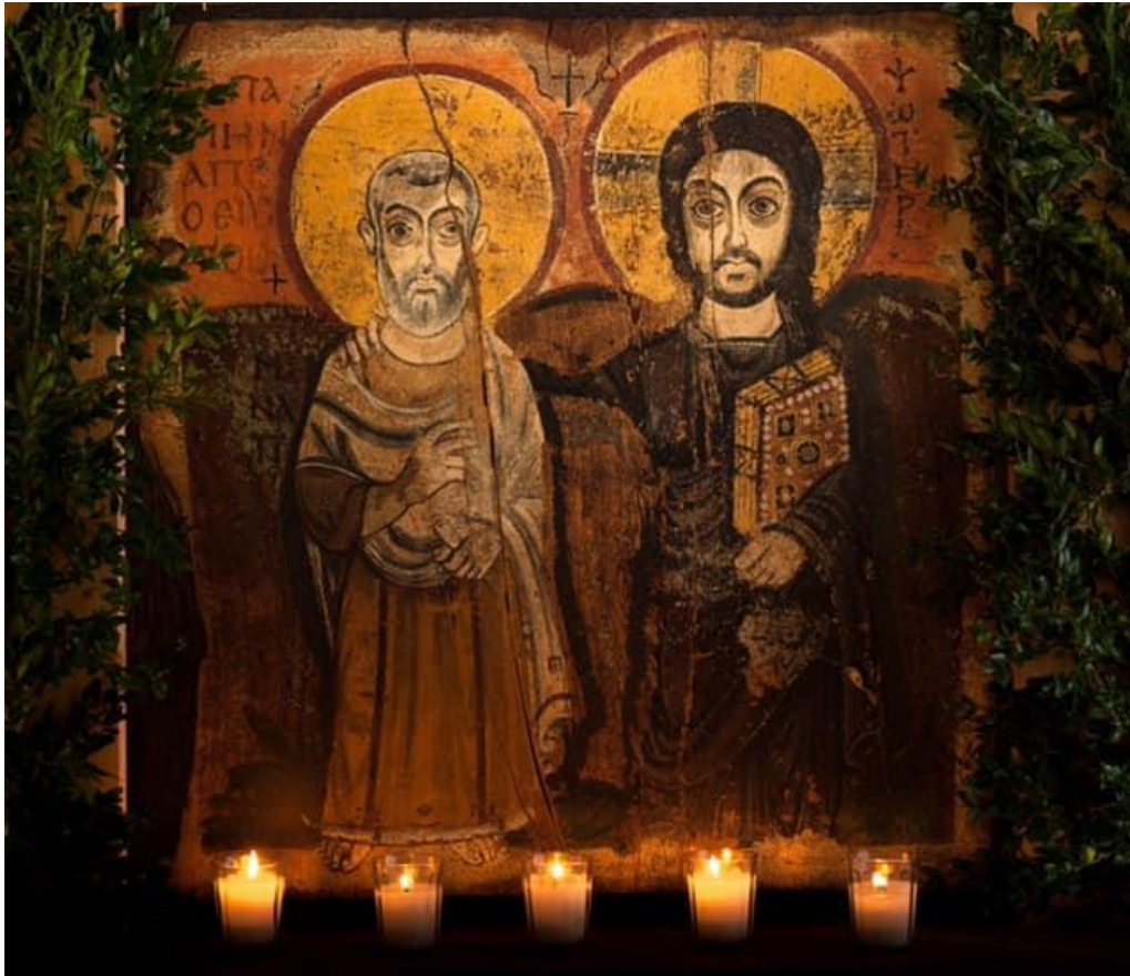
Ystävyysikon, Pyhä Menas ja Kristus. Koptilainen ikoni 500-vuoden lopulta.